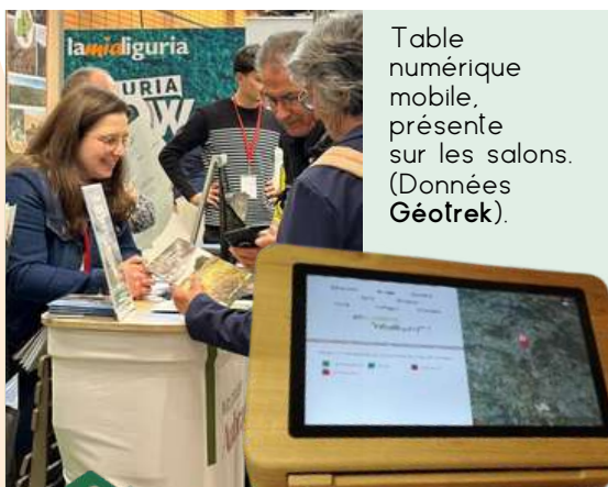
Table numérique mobile, présente sur les salons. (Données Géotrek).